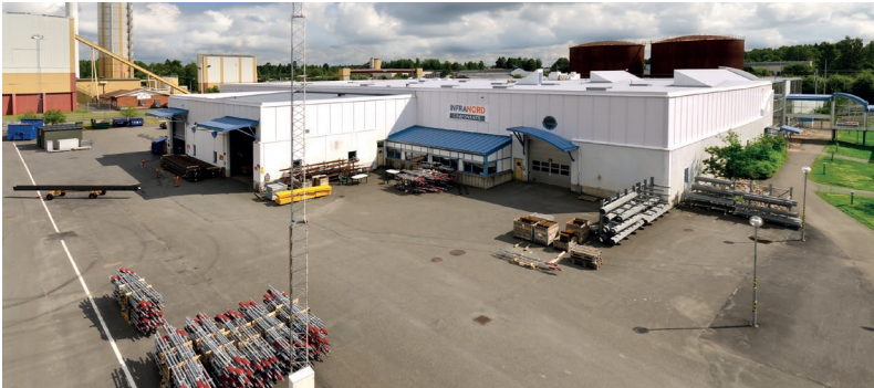
Infranord Components moderna och ändamålsenliga lokaler i Nässjö.